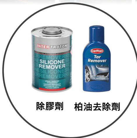
除膠劑 柏油去除劑